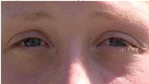
ECU (Extreme Close Up)

Je onderwerp is met zijn gezicht in beeld.