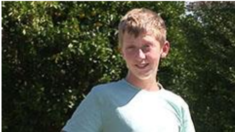
MCU (Medium Close Up)

Dit shot zit tussen een medium shot en een close up in.