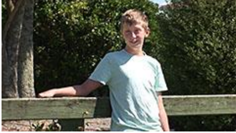
MS (Medium Shot)

Je onderwerp is tot aan zijn middel in beeld.