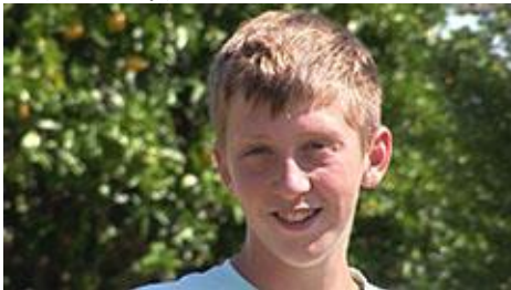
CU (Close Up)

Je onderwerp is met zijn gezicht in beeld.